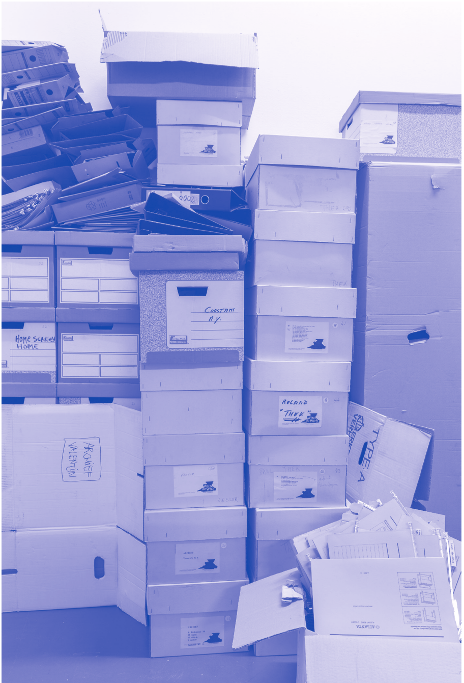
Oude archiefdozen Witte de With, 2016.