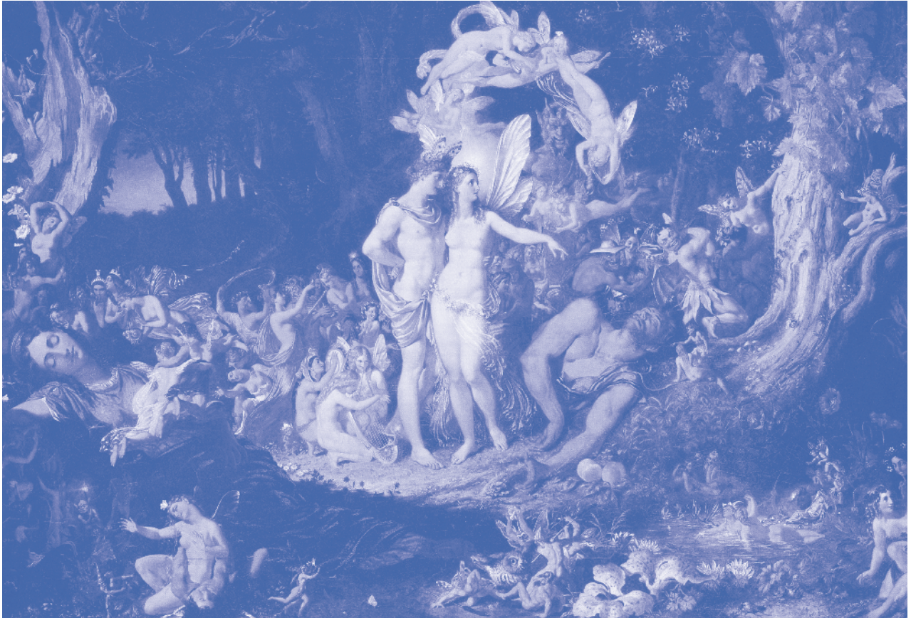
Sir Joseph Noel Paton, The Reconciliation of Oberon and Titania (1847), 76,20 × 122,60 cm, olie op doek, National Gallery of Scotland, Edinburgh, UK (detail)