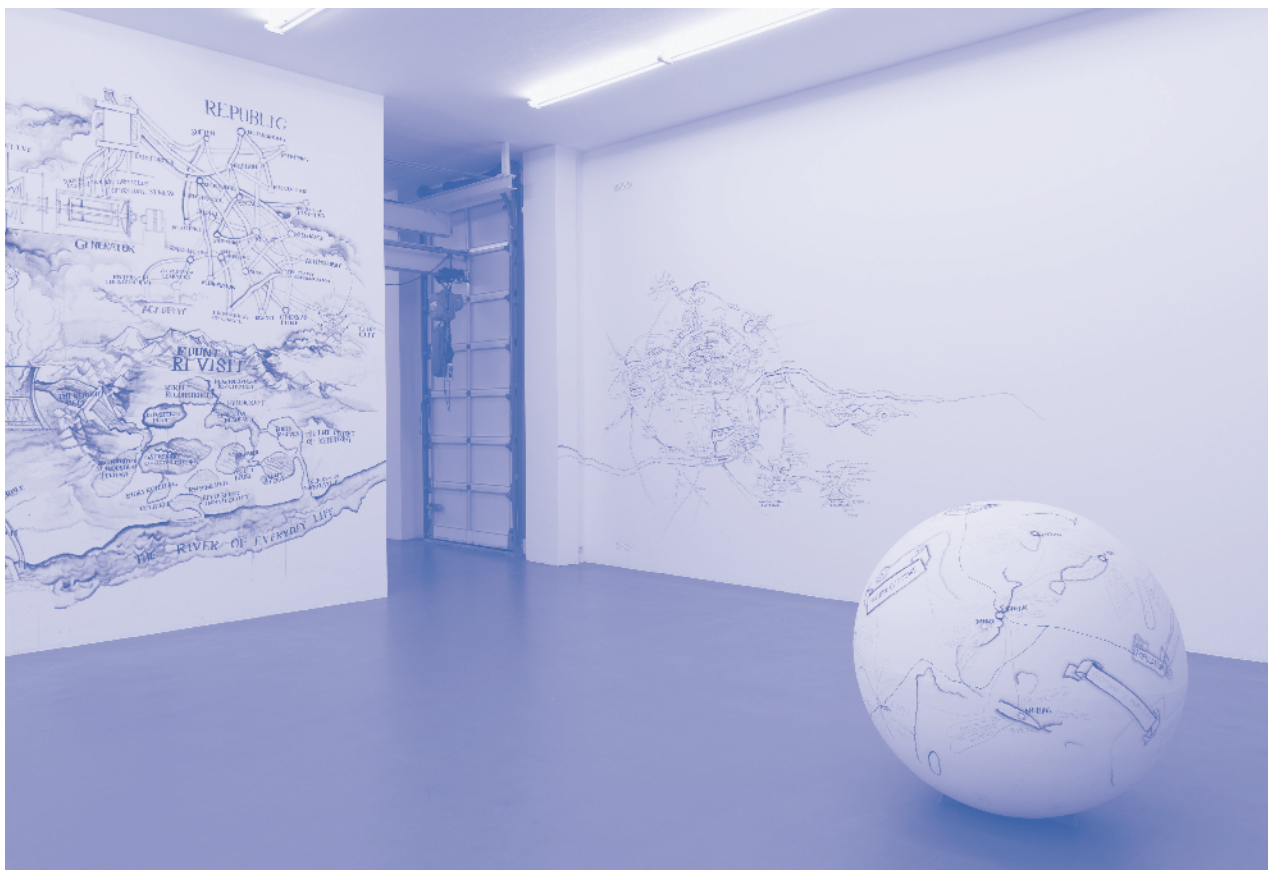
Qiu Zhijie, Blueprints , 2012. Installatieoverzicht.