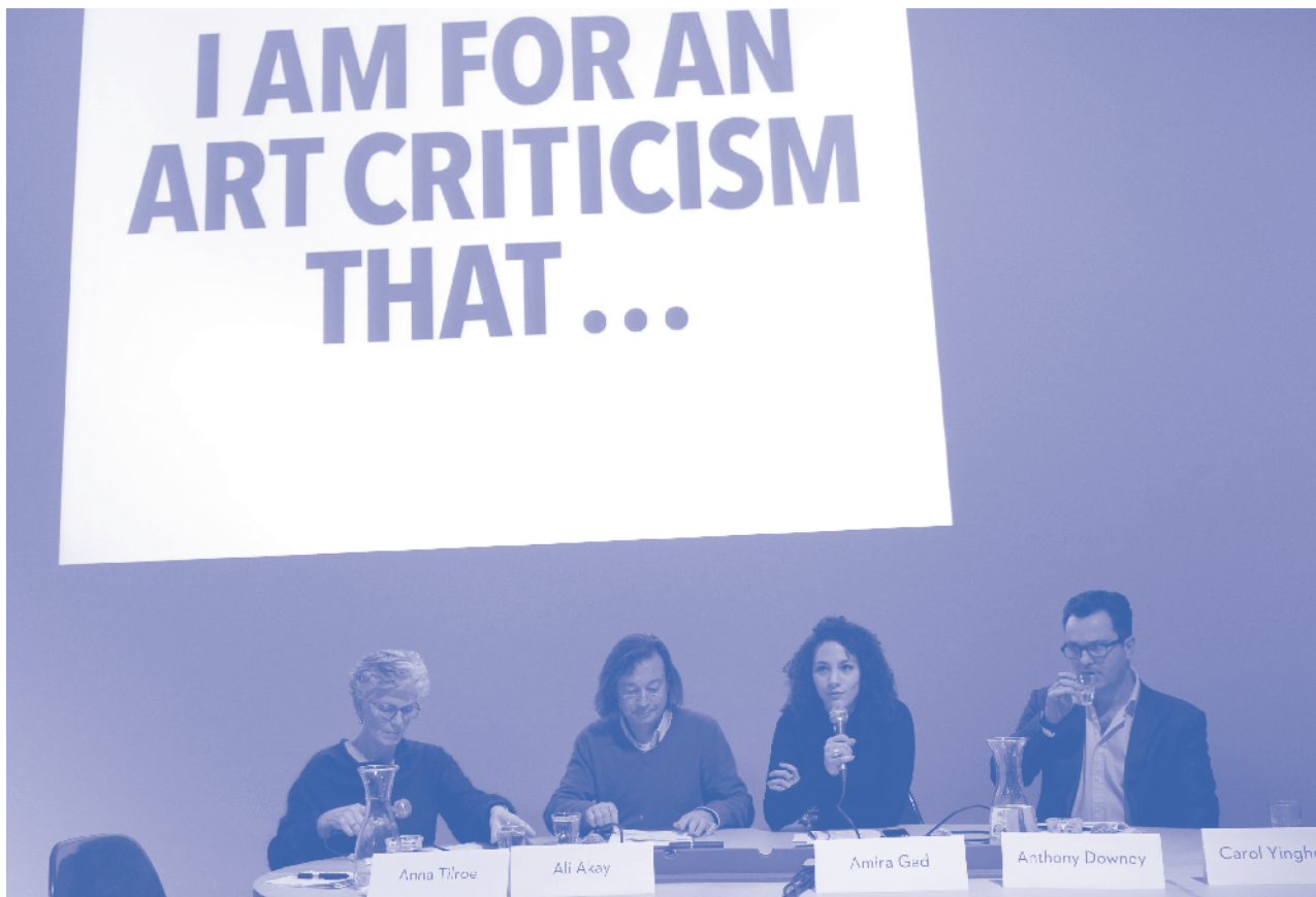
I AM FOR AN ART CRITICISM THAT... symposium 28 november 2012.